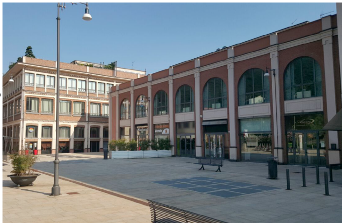
Borgo Wührer

Sitografia: https://it.wikipedia.org/wiki/Borgo_W%C3%BChrer