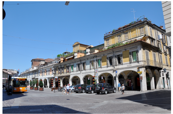
2011 Corso Zanardelli

www.iluoghidelsociale.it - Via Salgari,43 - 25125 Brescia - info@iluoghidelsociale.it