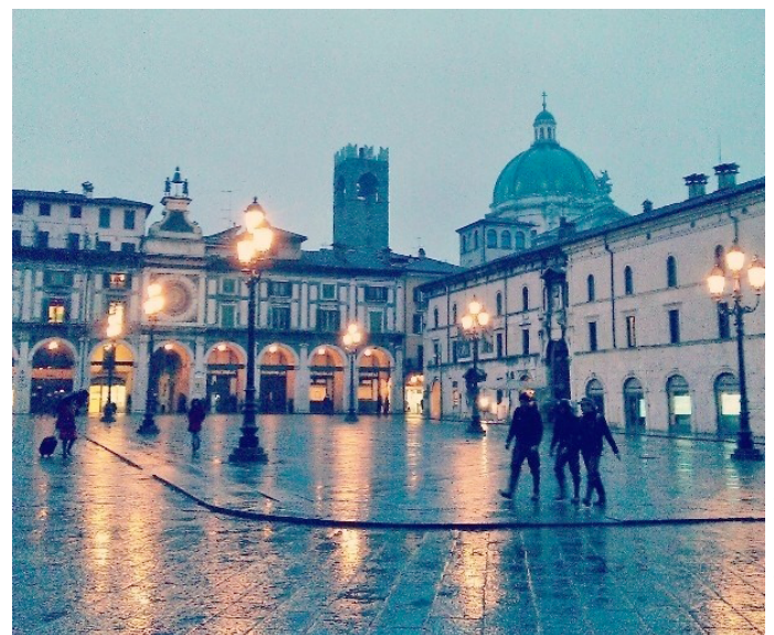
"Un pirlò per cortesia" "Campari o Aperol?"

Pirogga