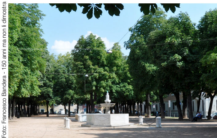
150 anni ma non li dimostra

Sitografia: http://www.turismobrescia.it/it/punto-d-interesse/piazza-tebaldo-brusato