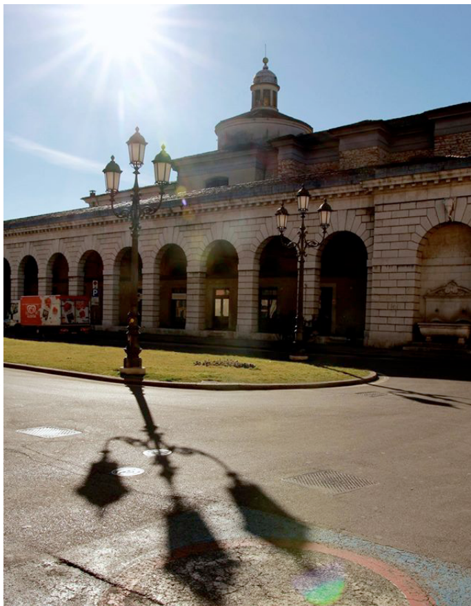
La luce svela una città, un'ombra la descrive

http://www.bresciastorica.it/foto-storica-piazzale-arnaldo-brescia-novecento/