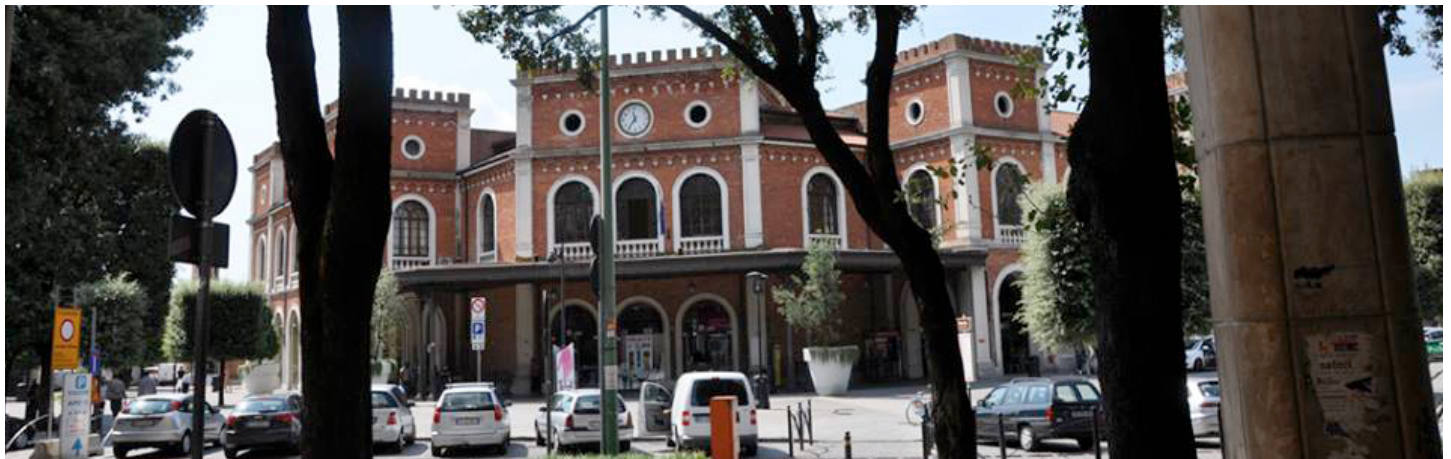
La stazione

Sitografia: http://www.stazionidelmondo.it/bresciastazione.htm