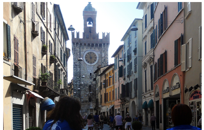
Brescia in Bici 2013

www.iluoghidelsociale.it - Via Salgari,43 - 25125 Brescia - info@iluoghidelsociale.it